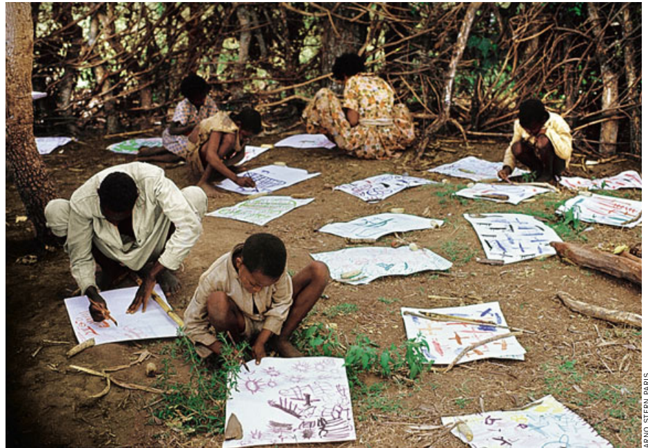
Stern-Aktion in Äthiopien (1972): „Eine schöne Blume – oder soll das die Sonne sein?“

Das sind die psychischen Nebenwirkungen des „Malspiels“, wie Stern es nennt – unabhängig vom Bildgegenstand. Doch Regelmäßigkeit, Vorhersehbarkeit fand er auch hier: Im Laufe der Jahre ging ihm auf, dass die ersten Malbewegungen aller Kinder entweder kreisende oder tupfende waren und dass aus diesen Bewegungen in