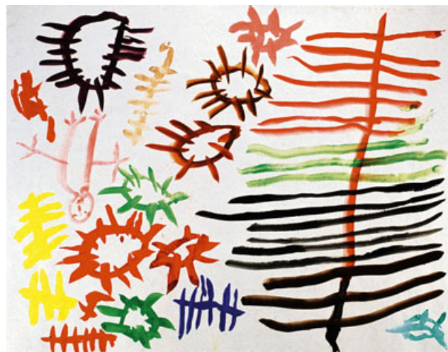
Stern-Übersichtstafel, Kinderzeichnung: Variationen der ersten Bildelemente